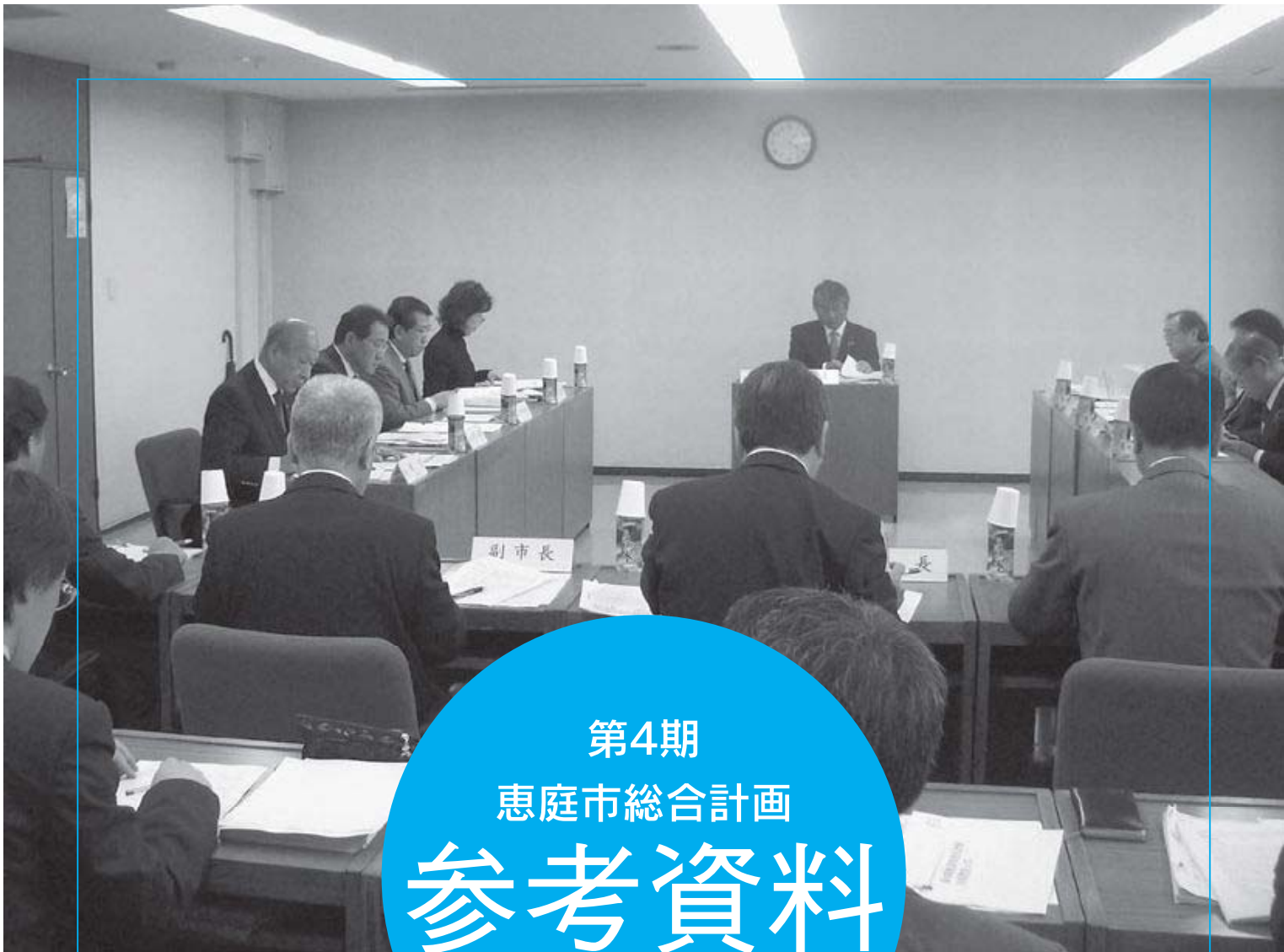
総合計画審議会の様子