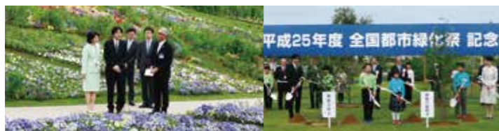
令和元年度全国都市緑化祭記念植樹

全国都市緑化フェア開催中の中心的行事として開催。例年、皇室の御臨席を賜る 主催：国土交通省、北海道、恵庭市、公益財団法人都市緑化機構 内容：式典（主催者挨拶、おことば、出展庭園コンテスト国土交通大臣表彰、緑の社会貢献賞表彰、緑化宣言等）、植樹 他