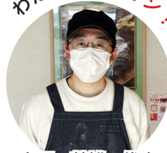
小国 英雄 代表

おススメは、高品質のベルギー産チョコレートクリームがたっぷりと詰まった「ちょっこ」。濃厚なチョコレートの風味が口いっぱい広がるぜいたくな味わいで、チョコレート好きにはたまらない一品です。