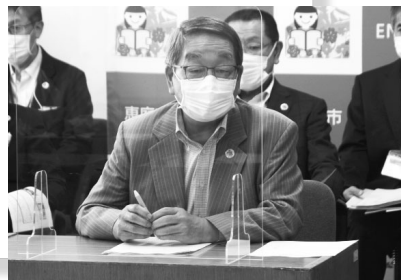
▲記者会見でのゼロカーボンシティ宣言

そして、この「パリ協定」という国際的な取り決めが合意されたことを受け、2020年10月、