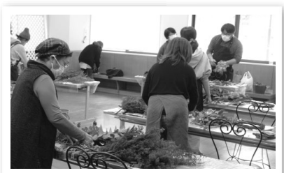
12/6 はなふるでいず「クリスマスリースづくり講習会」