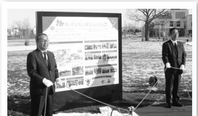
12/17 ガーデンフェスタ北海道 2022 記念プレート除幕式