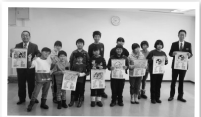
12/15 小中学校特別支援学級 児童制作カレンダー贈呈