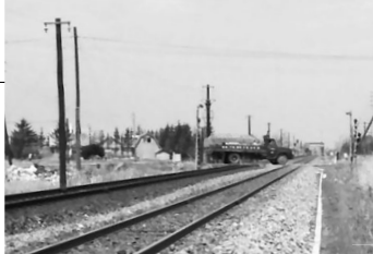
昭和47年4月 跨線橋設置前の基線踏切