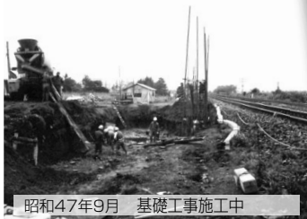
昭和47年9月 基礎工事施工中