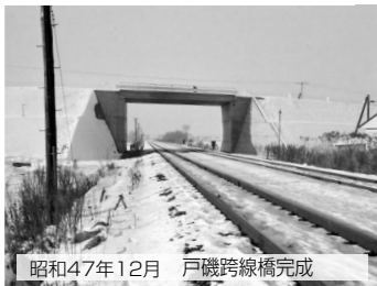
昭和47年12月 戸磯跨線橋完成