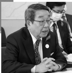
◀5/7 緊急記者会見の様子

問合せ先：図書館本館(☎37-2181 FAX37-2184) HPアドレス http://opac.city.eniwa.hokkaido.jp/