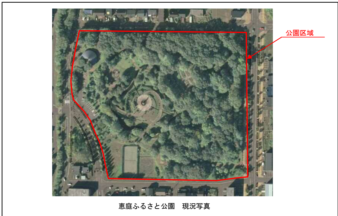
恵庭ふるさと公園 現況写真