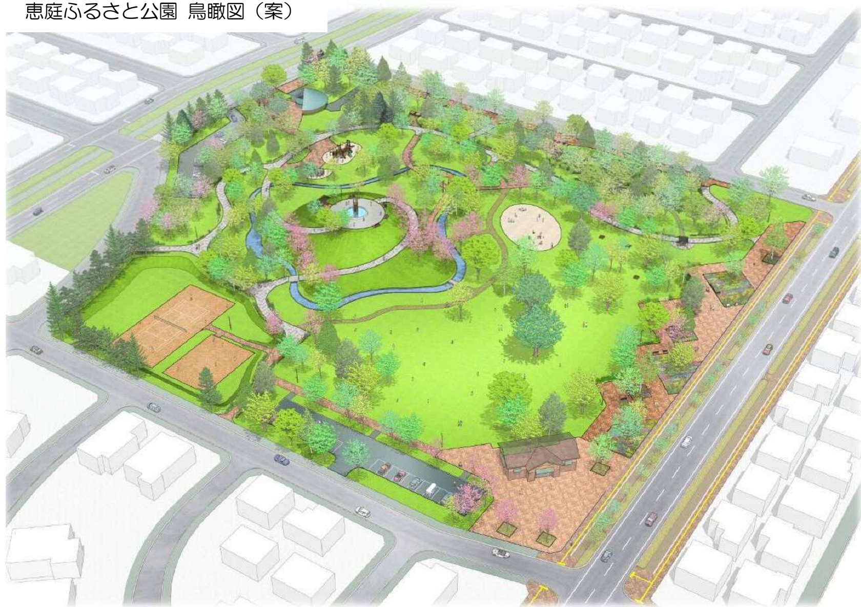
恵庭ふるさと公園 鳥瞰図（案）